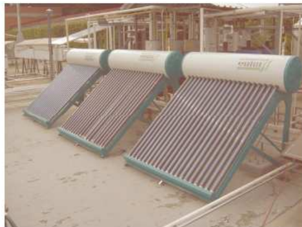
Imagen del producto ensayado en el laboratorio